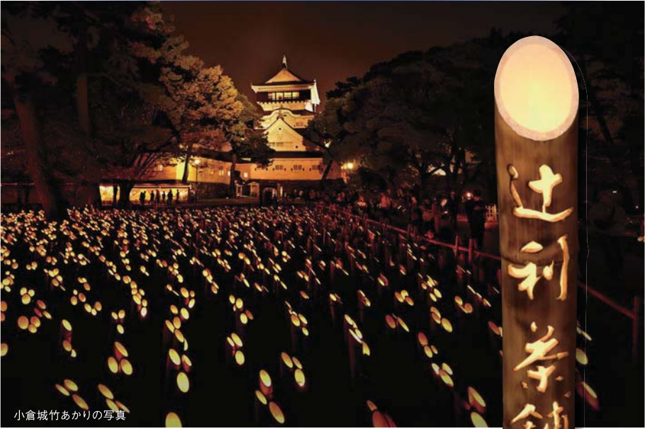
小倉城竹あかりの写真